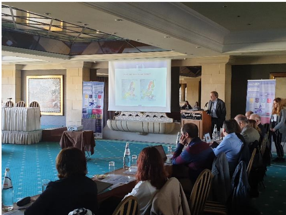
Εικόνα 2. Ο κ. Antonio Tricas Aizpuru, εκπρόσωπος της Ε.Ε. κατά την παρουσίαση του νομοθετικού πλαισίου και των στόχων του έργου.